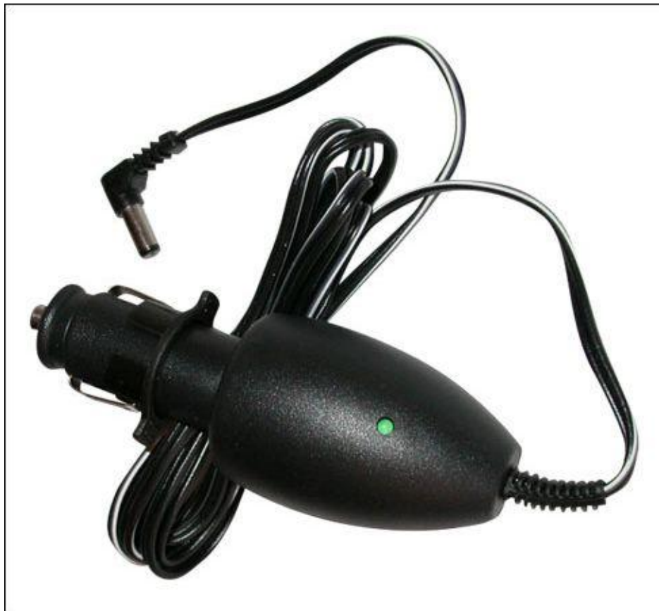
Rys.1. Widok ładowarki LDR-10S

OSTRZEŻENIE: Ładowanie akumulatorów zasilających wolno przeprowadzać wyłącznie poza strefami zagrożenia wybuchowego!!!